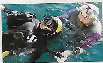
En surface, à proximité de l'embarcation : retirer lest et gilet...