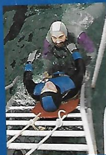
Planche et hissage à l'échelle...