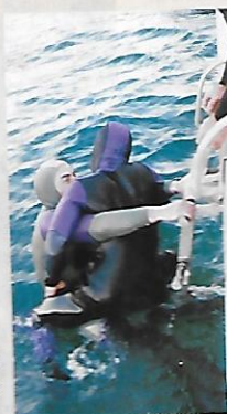
Sur un bateau ponté avec une échelle dite « perroquet »