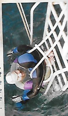
A l'échelle, en soulageant le poids de la victime à l'aide d'un bout...